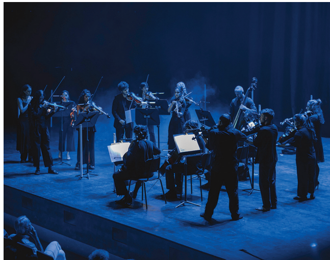
12 Ensemble @ Taufan Adia Putra

https://concreterep.com/artists/ben-ditto