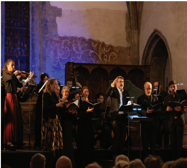
Gli Angeli Genève

aantal goede doelen in de stad. Het oratorium werd in 1742 voor het eerst uitgevoerd en zeer enthousiast ontvangen, waarna meerdere concerten volgden. Het werd één van de meest bekende composities van de Duits-Britse barokcomponist.