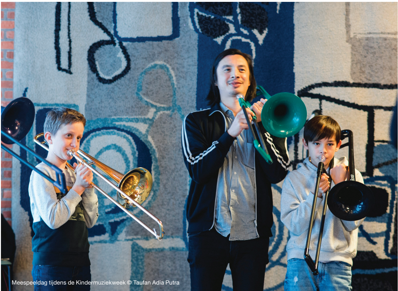
Meespeeldag tijdens de Kindermuziekweek