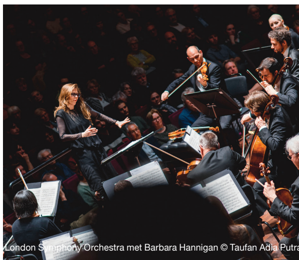
London Symphony Orchestra met Barbara Hannigan

Voor de werving van giften van het bedrijfsleven wordt actief gezocht naar potentiële sponsors. Het netwerk van de bestuursleden van het Steunfonds is daarvoor belangrijk. Zo is voorafgaand aan het concert van het London Symphony Orchestra in het voorjaar van 2023 een bijeenkomst georganiseerd, waar het verhaal van de Doelen werd verteld en was er een appel voor betrokkenheid.