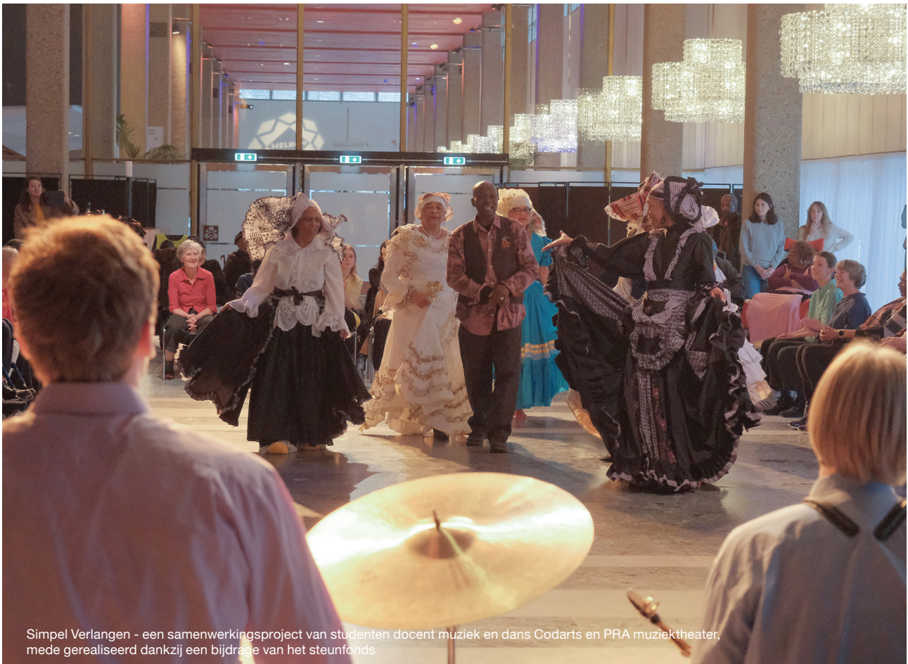
Simpel Verlangen - een samenwerkingsproject van studenten docent muziek en dans Codarts en PRA muziektheater, mede gerealiseerd dankzij een bijdrage van het steunfonds